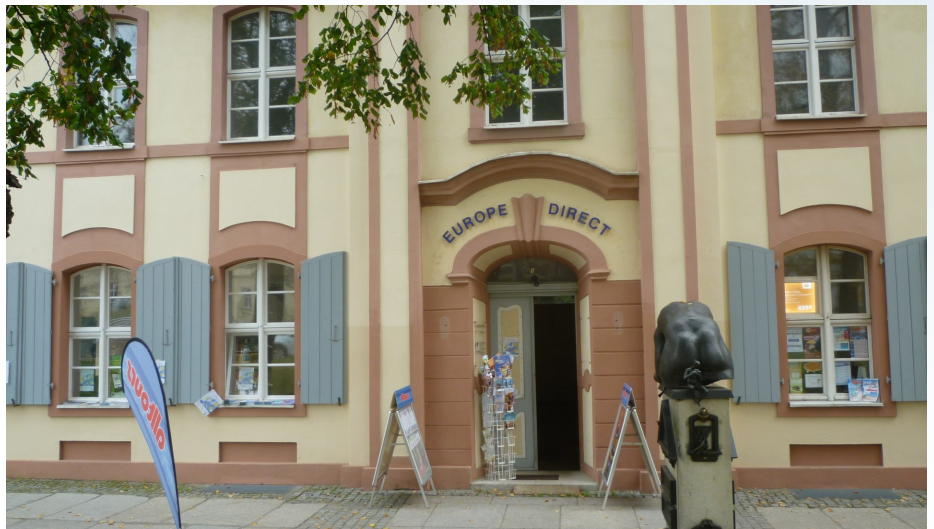
Das Besucherzentrum des EUROPE DIRECT Informationszentrums Frankfurt (Oder) in der Lindenstraße 5, 15230 Frankfurt (Oder).

steht den Bürgerinnen und Bürgern in Ostbrandenburg und im deutsch-polnischen Grenzraum als Anlaufstelle der Europäischen Kommission vor Ort zur Verfügung. Der Träger ist der Mittlere Oder e.V. Wir laden Sie ein, uns in unseren Räumen in der Lindenstraße 5 zu besuchen oder einfach auf unsere Homepage oder Facebook – Seite zu schauen. Für Ihre Veranstaltungen kommen wir auch gerne mit unserem Infostand zu Ihnen.